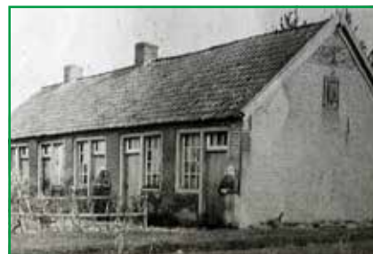
Armenhuis aan Hietveldweg

een woning aan de Wezenweg in Ugchelen. Tegen het einde van de 19 e eeuw was het armenhuis aan de Hietveldweg zo slecht, dat het onbewoonbaar was geworden. Het gebouw werd gesloopt en in 1904 werd, met financiële steun vanuit de bevolking, een nieuw armenhuis (later 'Dorpszicht') gebouwd voor vier gezinnen. De woningen waren nog steeds klein en vanwege de dunne wanden uiterst gehorig.