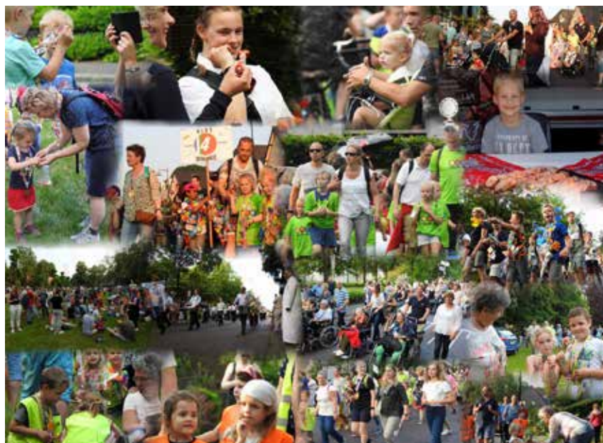
De traditionele intocht van de Avondvierdaagse vond afgelopen vrijdagavond plaats.